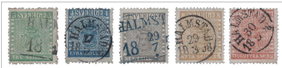
En färgrik serie med Halmstadstämplar på skilling banco.

bara sexskillingen på detta sätt, utan exempel på detta finns även för valörerna 4 och 8 skilling banco.