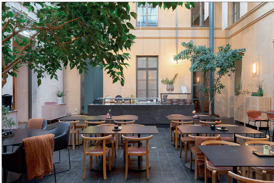
Ny restaurang.

Postmuseum bytte organisationstillhörighet den 1 juni 2019 och tillhör sedan dess Post-Nord Sverige AB.