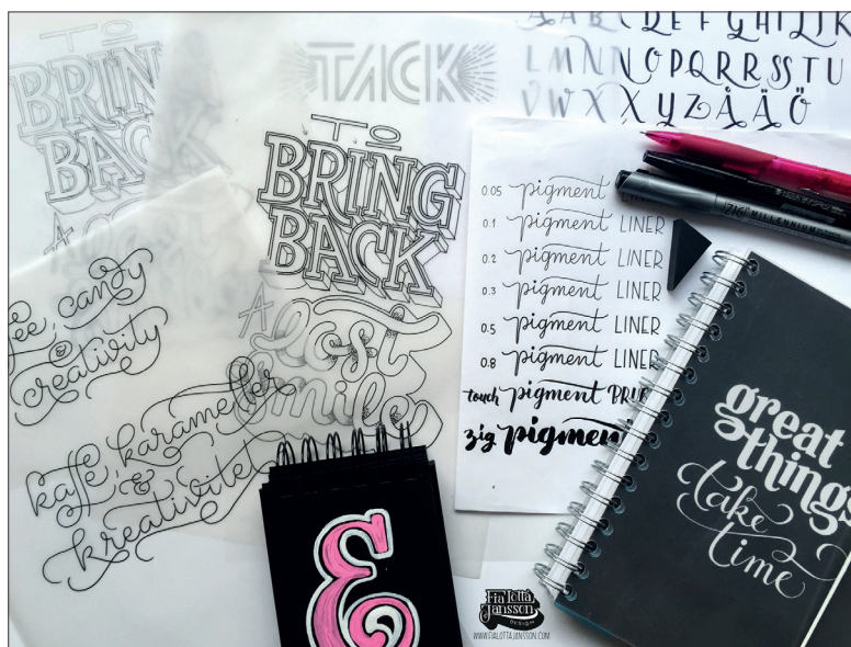
Lettering.