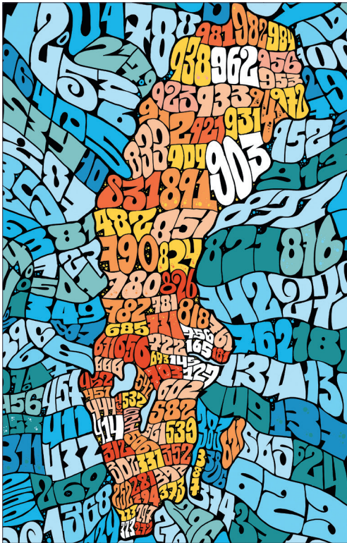
Postnummerkarta av Martin Ander.

Utställningarna, kommunikationsaktiviteterna och det pedagogiska arbetet bygger alla på vårt varumärkeslöfte: att vi ska vara ett museum som på ett lekfullt, lärorikt och aktuellt sätt berättar PostNords svenska historia.