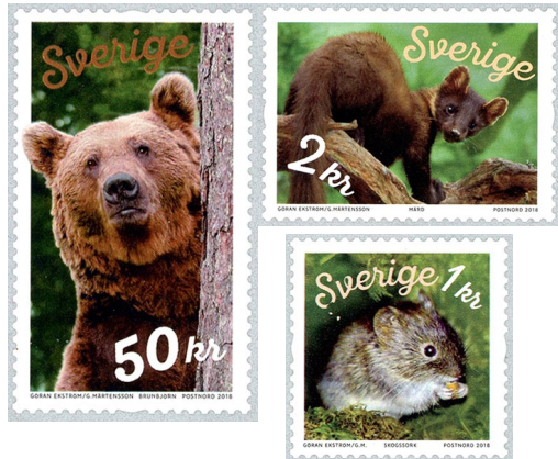
Frimärkena skogens djur: Fotografier av Göran Ekström. Grafisk form av Gustav Mårtensson.

Föredraget var mycket uppskattat av de 25-talet närvarande medlemmarna. Många frågor ställdes till föredragshållaren.