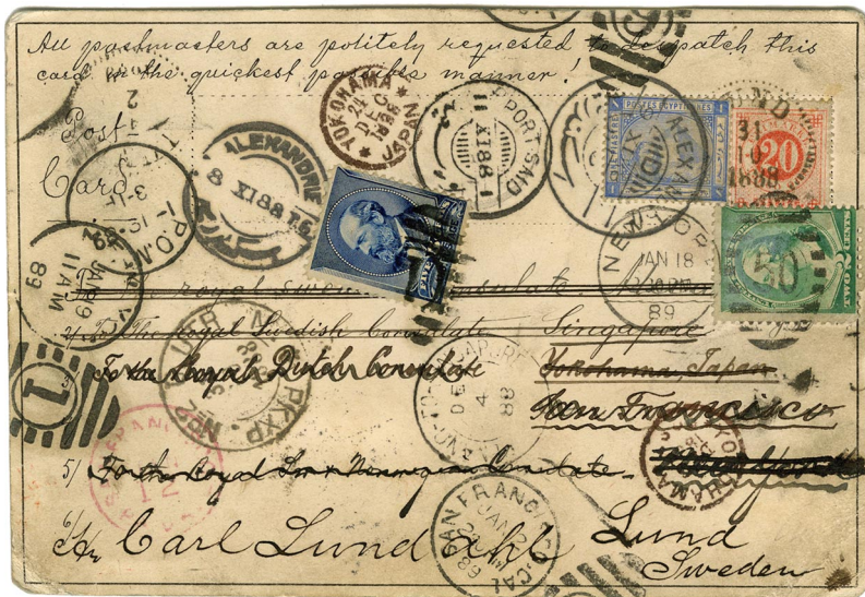
Jorden-runt brevkort avsant från Lund den 30 november 1888, med ankomst till Lund den 4 februari 1889.

Postmuseum deltog i "Arkivens dag" som genomfördes den 12 november. År 2011 hade den temat "konst".