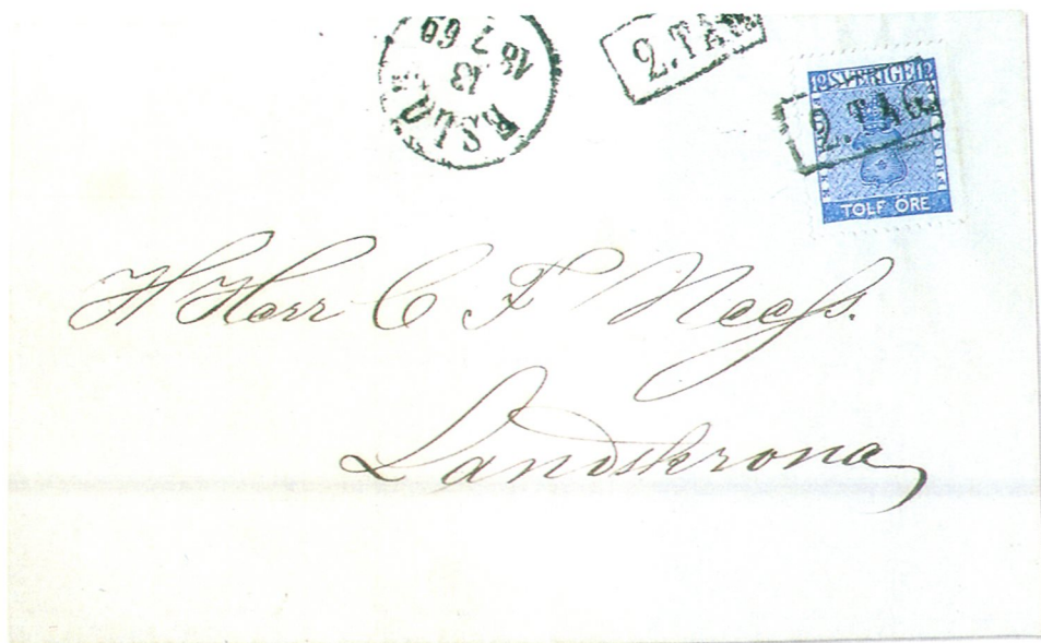
Eslöfs första tågstämpel, här med insatt siffra 2, för att indikera att brevet sänts med middagståget till adressorten Landskrona. Frimärket har makulerats med tågstämpeln vilket var i strid med gällande bestämmelser.