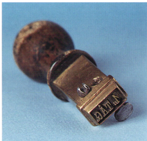
En av de två tågstämpelstamparna som omnämns i artikeln finns bevarad i Postmuseums föremålsamling.