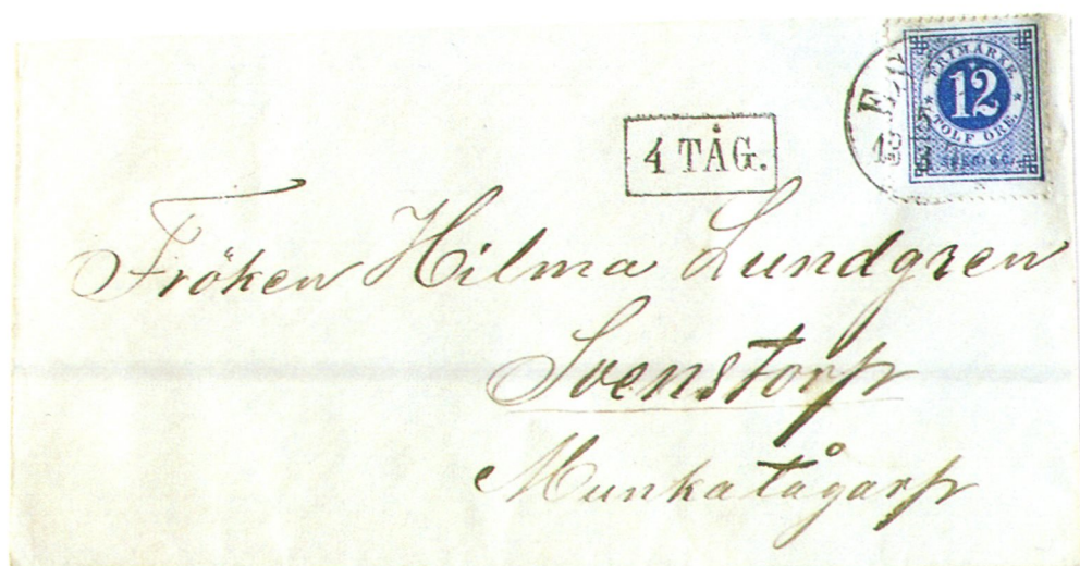
Eslöfs andra tågstämpel, här med insatt siffra 4, för att indikera att brevet avsänts med det nu sista för dagen avgående tåget.