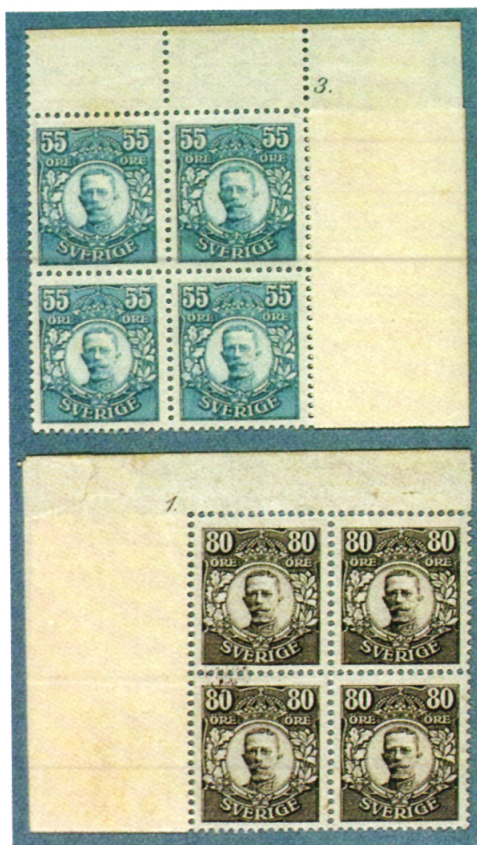
Fyrblock av de båda Värnamofrimärkena, Gustaf V i medaljong, 55 öre och 80 öre. Katalogvärde enligt Facit Sverige 1996 20 000 kr för enstaka postfriska märken.

Varje "halfark" innehöll 100 frimärken. Den totala upplagan fullgoda 55-öresfrimärken uppgick alltså till 1 362 400 fri-