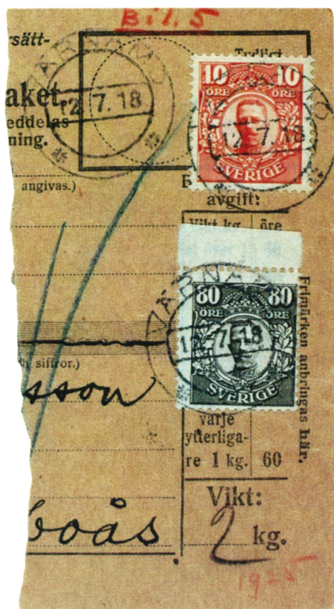
Del av adresskort till inrikes paket frankerat med 80 öre och 10 öre Gustaf V i medaljong. Märkena makulerade med antedaterad stämpel Värnamo 12 juli 1918. På baksidan två avtryck av antedaterad stämpel Västboås 13 juli 1918.