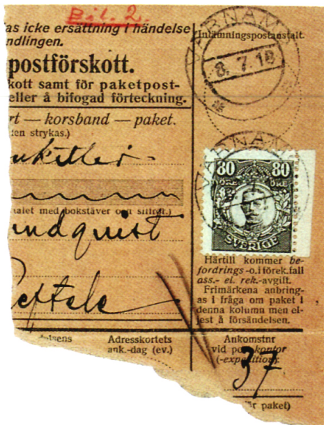
Del av adresskort till inrikes postförskottspaket frankerat med 80 öre Gustaf V i medaljong. Märket stämplat med antedaterad stämpel Värnamo 8 juli 1918. På baksidan fragment av antedaterad stämpel Rettele 9 juli 1918.