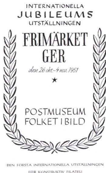
Titelsidan på FIB:s katalog över utställningen "Frimärket ger".

1951, 26 oktober - 4 november. Frimärket ger. I utställningen deltog ett hundratal motivsamlare från 16 länder. Ett urval av