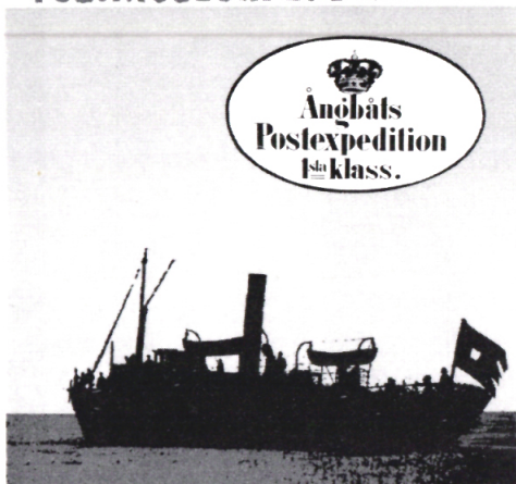
Postkort utgivet i samband med utställningen "Båtpost".

med broschyrer. Museet samarbetade med Svenska FN-förbundet med anledning av att 1968 av FN proklamerats som de mänskliga rättigheternas år.