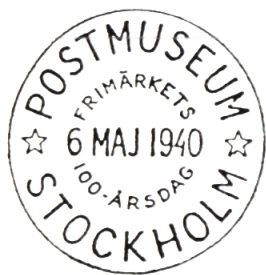
Minnespoststämpeln till 100-årsfirandet av världens första frimärke.

1938, 16 - 26 mars. Framärken för ungdom. Framärken ordnade efter länder men även under andra rubriker såsom sport, musik och fartyg. Samtidigt visades skämtbilder om posten, både svenska och utländska. Postmusei svenska framärksamling hade ommonterats i nya monterställ framtagna i samarbete med NK. Postmuseum som i vanliga fall var öppet söndagar och onsdagar kl 13-15 hade under utställningen öppet varje dag kl 13-15 och den 16 samt 23 mars även kl 19-21.