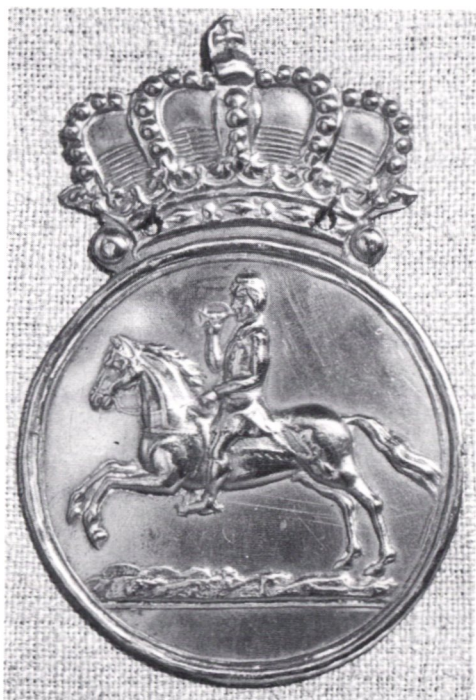
Postiljonsbricka från 1800-talet.

Framme vid Nösnäs, nära nuvarande Stenungsund, kliver Olaus av och går ned-