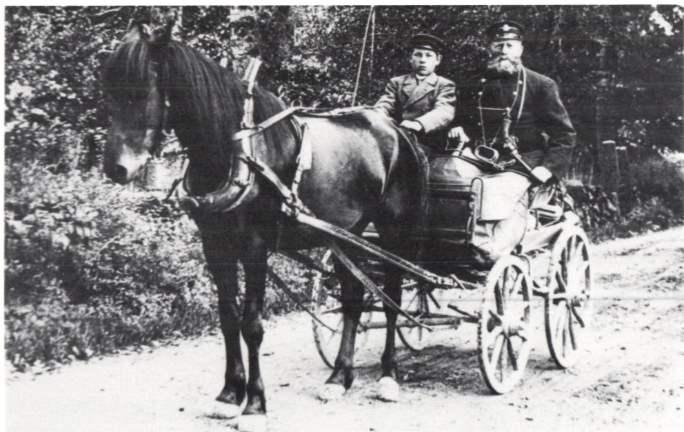
Posttransport i Kalmarbygden 1895.

flera pistoler och en sabel. Det hörs nog hur sabelbaljan slarar mot vagnkanten när han tar plats på sätet.