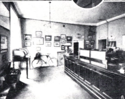
En sida ur Idun år 1915.