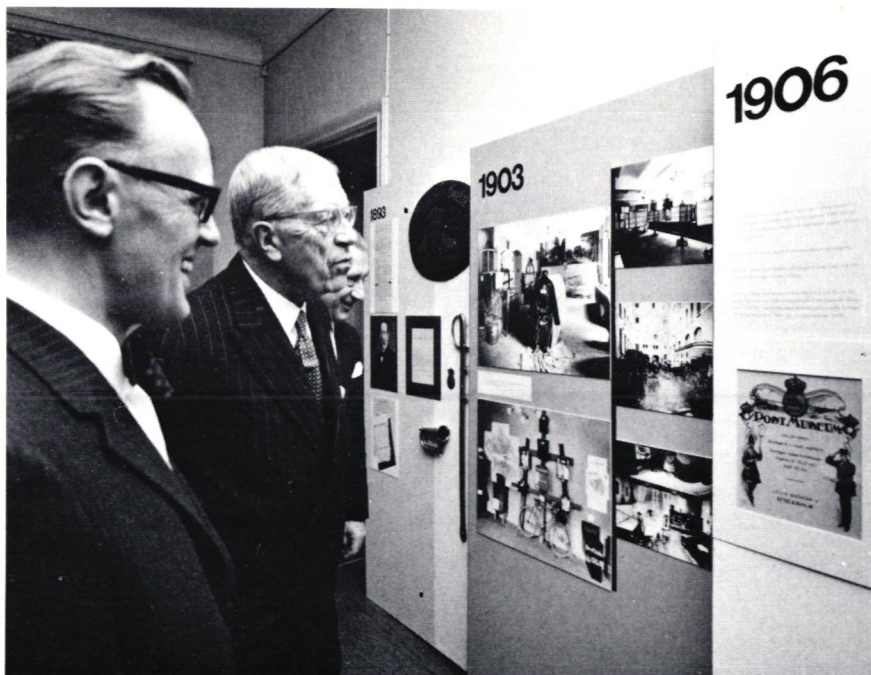
Gustav VI Adolf visade stort intresse för det 60-åriga museet.

Det har blivit något av en tradition att söka skildra någon av årets utställningar i Postryttaren. En utställning som av flera olika skäl bör komma i fråga är den som beskriver Postmuseums första 75 år.