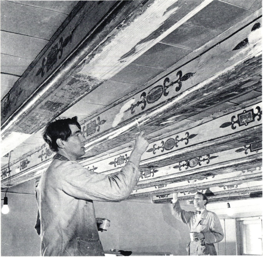
Takbjälkarna i en av frimärkssalarna en trappa upp togs fram 1955 och för första gången kunde man få bekräftat att byggnaden från 1638 finns kvar i det nuvarande huset.