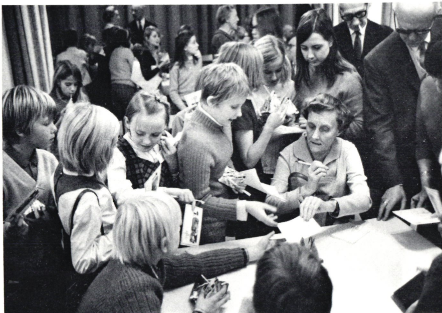
Astrid Lindgren invigde utställningen God Jul Glada Barn år 1969 och fick erfara kändisens hårda liv.

De posthistoriska utställningarna röner också stort intresse bland både filatelister, postfolk och allmänhet. Det svenska postverket som snart firar sitt 350-årsjubileum (1986) har en intressant historia. Många olika befordringssätt har kommit till användning i vårt avlånga land. Många äventyr finns att berätta om – både till lands och till sjöss.