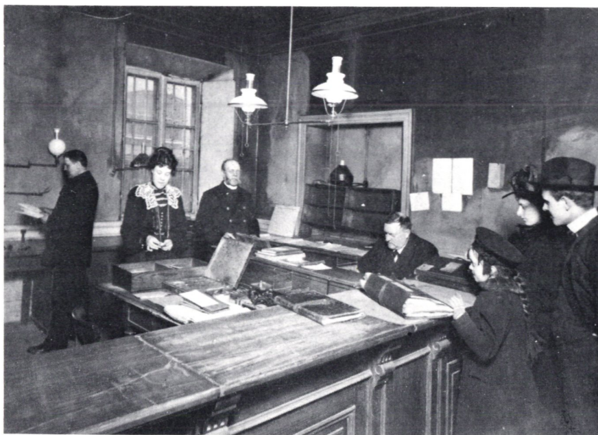
År 1903 hade postkontoret Stockholm 2 expeditjonslokal i nuvarande flygpostrummet.

Generalpostdirektören Edvard von Krusenstjerna var medveten om tidens strömningar och anslag generöst en summa av 1 000 kronor om året för nyanskaffning av föremål. Det låter anspråkslöst i våra dagars valuta, men det måste varit mycket mera då och dessutom medverkade på alla håll idealitet och entusiasm.