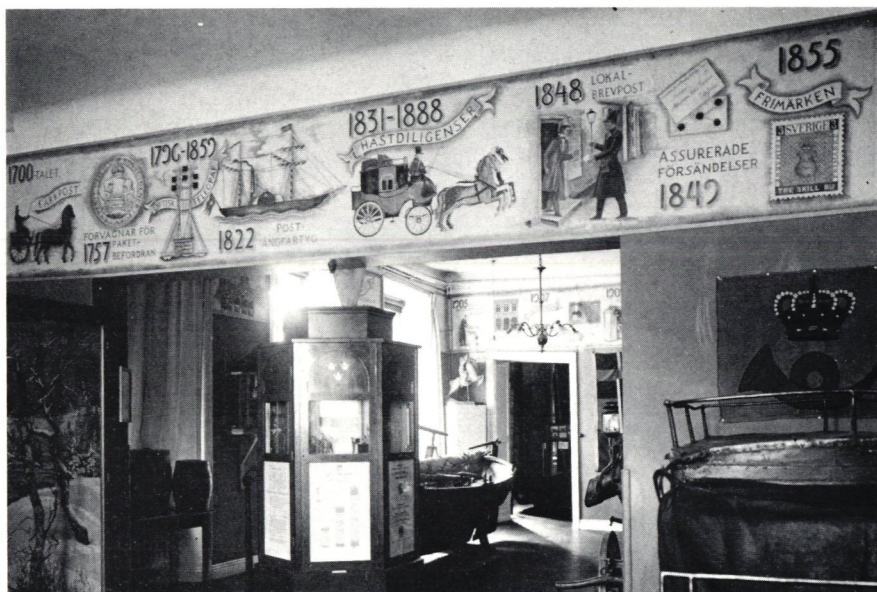
Under Jerk Werkmästers fris som skildrade Postens historia kunde man 1927 finna ett tittskåp med rörliga bilder.