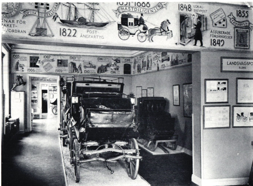
Den posthistoriska frisen fortsatte genom rummen och placerade in diligenser och annat i sitt sammanhang. Här ses de i rummen två trappor upp!