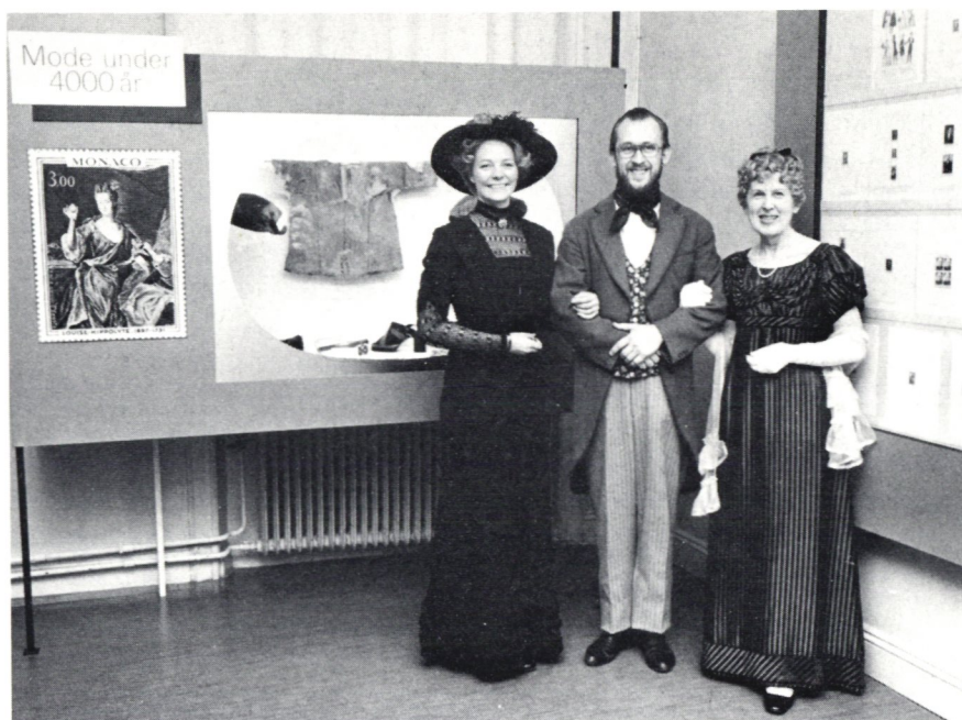
Mode under 4000 år visades på frimärken 1975. Vid invigningen var museets personal klädd i nästan lika gamla dräkter.

Det filatelistiska biblioteket, som uppstod genom en gåva från postmästare Holm, utökades på 1940-talet genom inköp av Nils Strandells filatelistiska bibliotek, då omfattande 17 000 nummer. Detta bibliotek har efter hand kompletterats och omfattar nu ca 40 000 band. Äldre tidskrifter, kataloger och auktionskataloger är också av stort intresse eftersom de knappast finns att tillgå på annat håll. Museets bibliotek följer också fackpressen och köper in värdefulla utgåvor. Eftersom Kungl Biblioteket inte bevakar utländsk filatelistisk litteratur, är Postmuseums bibliotek det enda fackbiblioteket i Sverige.