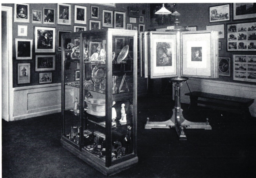
Detta vitrinskåp från 1927 kunde rekonstrueras med sitt innehåll till jubileumsutställningen 1981.