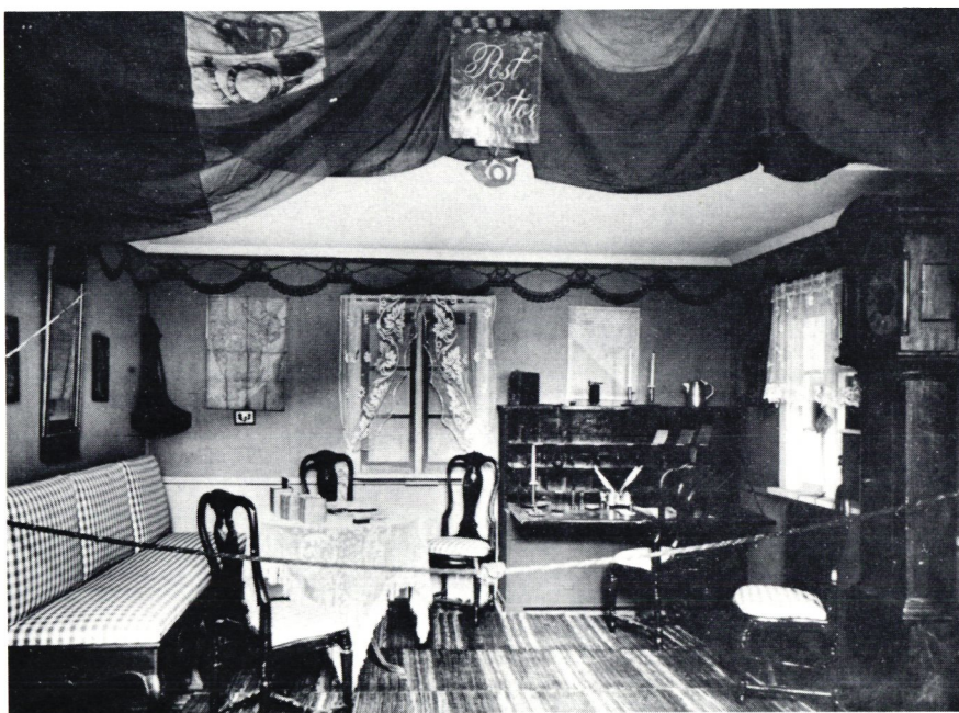
Postkontoret från 1830-talet – numera med »levande» postmästare – är sig likt från 1903.

Den 16 december 1906 kunde museet öppnas i de anvisade lokalerna och med de föremål Långe lyckats uppbringa. Ett förvånande stort antal föremål hade följt med från utställningen 1903. Bland annat fanns den interiör från ett postkontor på 1830-talet, som genom alla år fångslat besökarna, i synnerhet sedan den i slutet av första världskriget försågs med en »levande» pensionerad major som postmästare. Det var kejsar Frans Josef från Stockholms Panoptikon som fick den rollen. Interiören skänktes av utställningsarrangörerna och de bekostade dessutom flyttning, anpassning och uppmontering av alla tjänsterummets tillbehör.