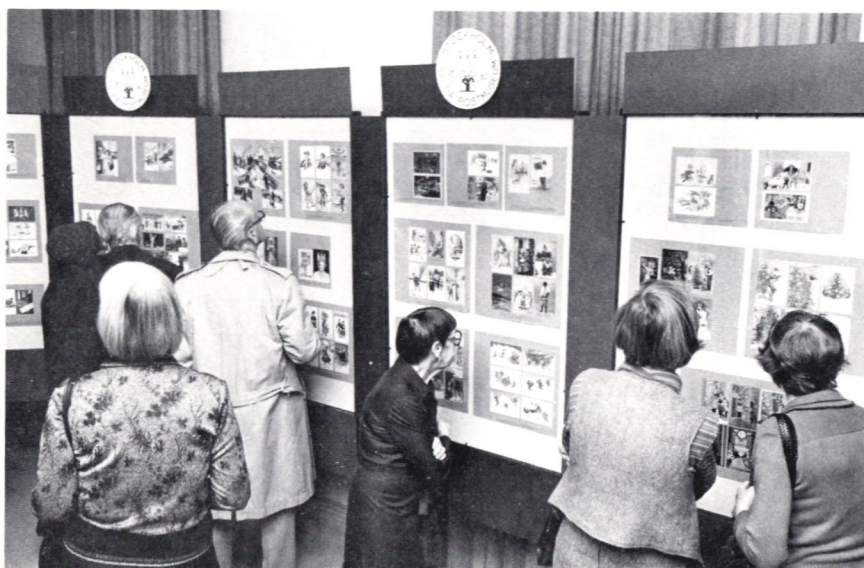
Julkort blir aldrig för gamla.