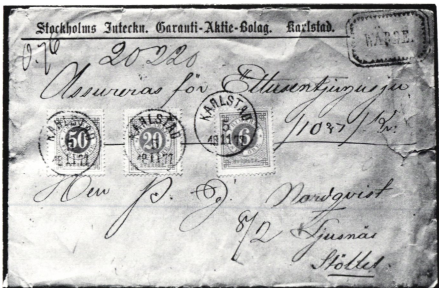
Kuvert till assurerat brev från Karlstad 5.11.1877 till Stället frankerat med 6, 20 och 50 öre Ringtyp, perf 14. (Gåva från Postmusei Vänner).