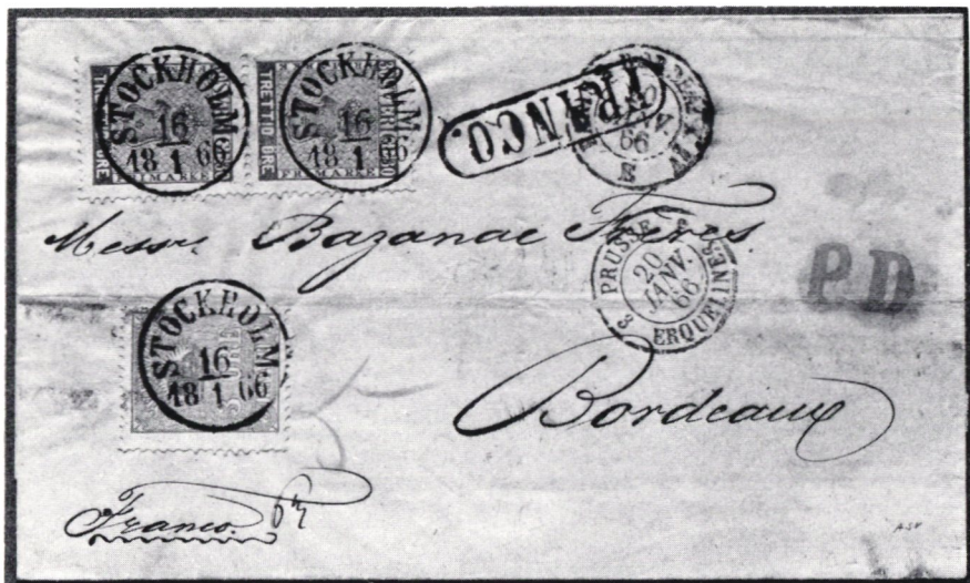
Brev från Stockholm 16.1.1866 till Bordeaux frankerat med par av 30 öre Vapentyp och 3 öre liggande lejon typ II. (Gåva från Postmusei Vänner).

slinga, till Hagby kyrka okt 1808; Kungörelse 1812 (uppbådande av en del av beväringsskicket) till Holmerud; Brevomslag med rakstämpel Alingsås till Mariestad; Brevomslag med rakstämpel Cimbritshamn till Lund; Brevomslag med rakstämpel Hofva till Mariestad; Brev stämplat med Stockholms första fribrevsstämpel 6.12.1830 till Mariestad; Brev med bågstämpel Grisslehamn i röd färg 9.1.1854 till Stockholm; Brev med 2 ex 3 öre Liggande lejon typ I sänt inom Stockholm 17.7.1863; Brev från Stockholm 16.1.1866 till Bordeaux frankerat med par av 30 öre Vapentyp och 3 öre Liggande lejon typ II; 20 brev frankerade med 12 öre Vapentyp, varav