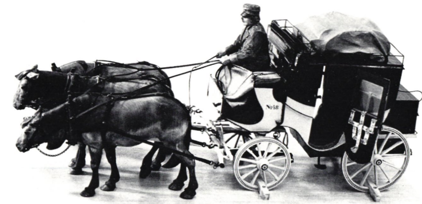
Postdiligens på 1870-talet. Modellen har renoverats för att ställas ut i dioramarummet.