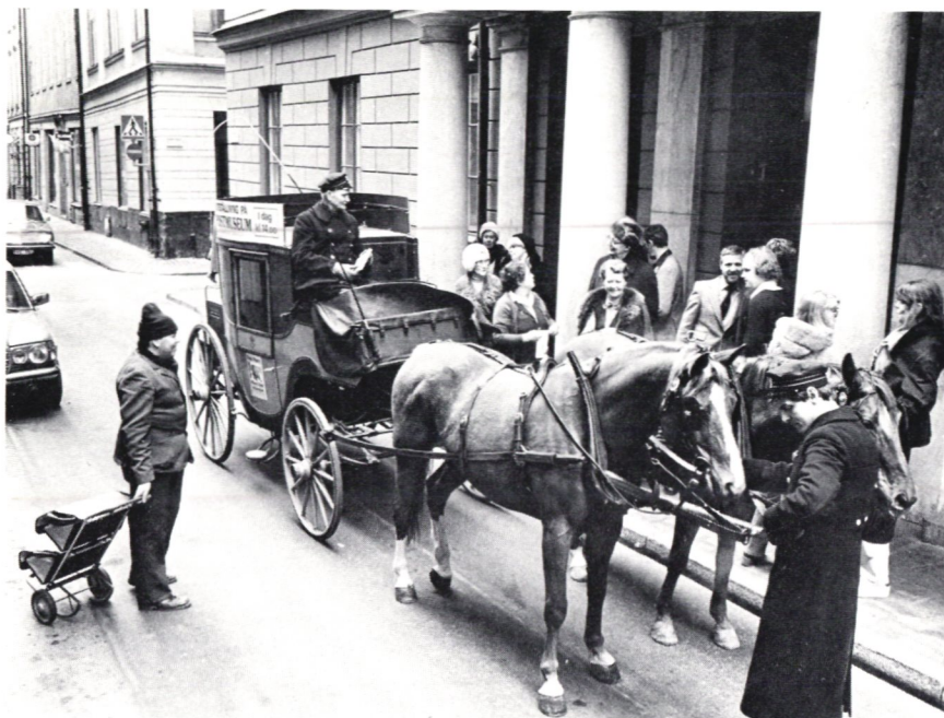
Utställningen »Post i norr» gav anledning till att återuppta diligenstrafiken i centrala Stockholm.