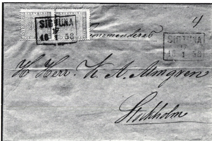
Brevomslag frankerat med par av 8 sk bco och stämplat 17.1.1858 med Sigtuna fyrkantstämpel i grotesk still (normalstämpel 8).

latur-Specimen»; Album med Stora tjänste, stämplade och ostämplade, singelmärken och 4-block; Stora tjänstefrimärken perf 13 stämplade, 3, 4 och 50 öre i nyanserna gulbrun, ljusgrå resp grå.; Sju förfilatelistiska brev med innehåll, från Göteborg till Nürnberg, samtliga med oval franco-stämpel med undantag av ett som har fyrkantig d:o samt stämpel »Aus Schweden»; Brevomslag stämplat med Alingsås, rakstämpel; Brev med innehåll från Stockholm 10.9.1844 till Rostock via Stralsund, stämplat »frco Stralsund»; Brevomslag frankerat med par av 8 sk bco och stämplat 17.1.1858 med Sigtuna fyrkantstämpel i grotesk stil (Normalstämpel 8); Brevomslag stämplat PKXP Nr 1 och Stockholm Nr 7 13.12.1871 till Finland med röd ANK-stämpel; Paketadresskort från Lund 17.9.1889 till Ölands Sandby, på