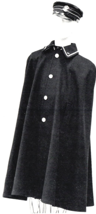
Nyuppsydd regnkrage och mössa för utlåning. Regnkragen infördes 1901 för postbetjänte i brevbäring och brevlådtömning med cykel.