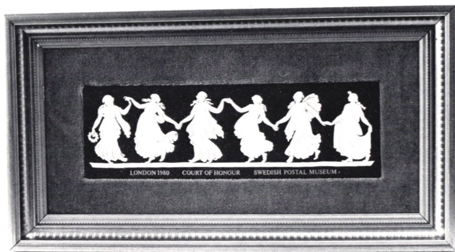
Hederspris från frimärksutställningen »London 80», kallad Dancing Hours med motivet utfört i Wedgwoodporslin.