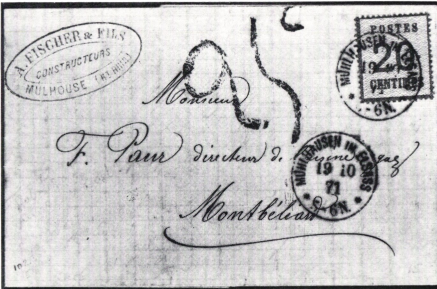
Brev från de ockuperade områdena till Frankrike avsända efter den franska portohöjningen 1871-09-01. Brevet försedda med olika franska lösenstämplat (25 c).