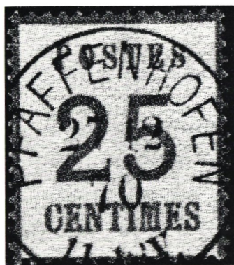
En vackert stämplad 25 c med omvänt bottentryck.

Av naturliga orsaker ansåg man sig ej kunna använda varken franska eller tyska frimärken utan framställde en särskild frimärksemission: de sk Elsass-Lothringenmärkena . Dessa trycktes av Nationaltryckeriet i Berlin. Eftersom det gällde att få fram märkena snabbt gick man ganska