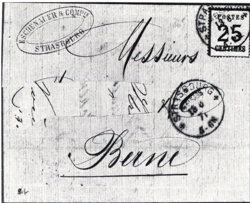
Brev från Strassbourg i Alsace till Bern i Schweiz.

enkelt tillväga. Märkena trycktes i två omgångar och i samma färger och valörer som de franska. Först försågs de med ett vågformigt undertryck som på Nordtyska förbundets egna märken. I andra omgången trycktes valörsiffran och ramen samt orden POSTES och CENTIMES. För att få fram detta använde man sig av ordinarie lösa »typer» och plockade på så sätt ihop varje märkesbild. Detta plock gjorde att man fick en hel del smärre variationer i märkesbilden. På varje ark kom sedan att finnas 150 märken i 15 vågräta rader om 10 märken.