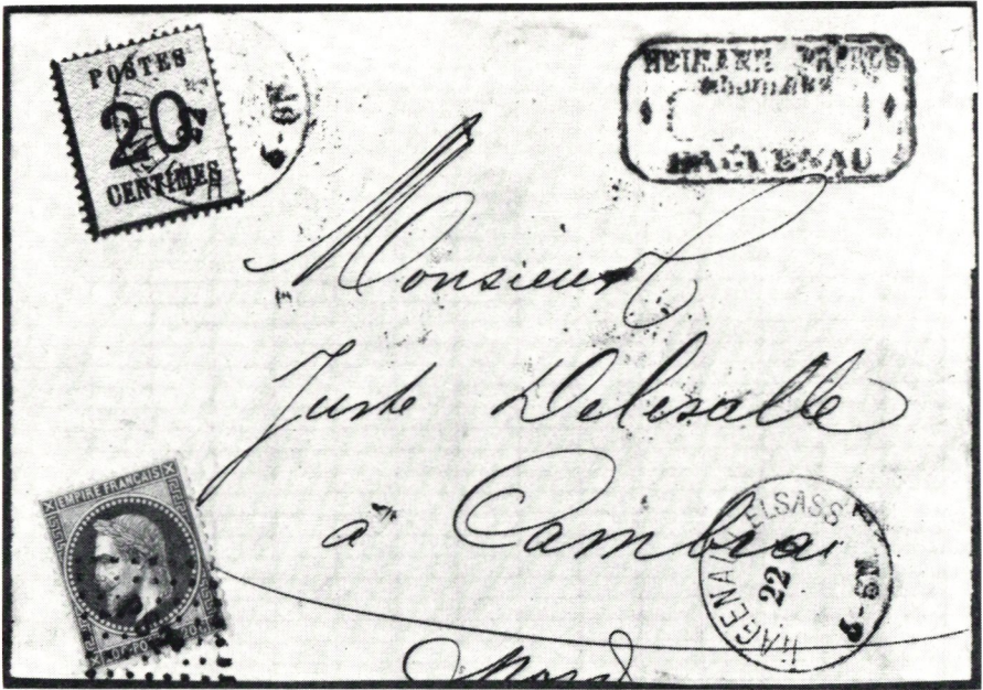
Brev från det tysckockuperade Haguenau 71-05-22 till Cambrai i det fria Frankrike försett med såväl tysk som fransk frankering, som makulerats med resp. områdes stämpelar. »PS 2» är en fransk järnvägspoststämpel (Paris à Strassbourg, natt).

Den 25 mars 1871 fick fransmänen tillbaka förvaltningen av posten i de ockuperade områdena. Dock ej i Elsass-Lothringen, som annekterats av tyskarna och där ockupationsmärkena ägde giltighet intill den 31 dec. 1871.