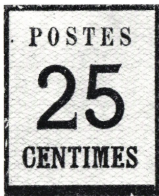
1885 års eftertryck.