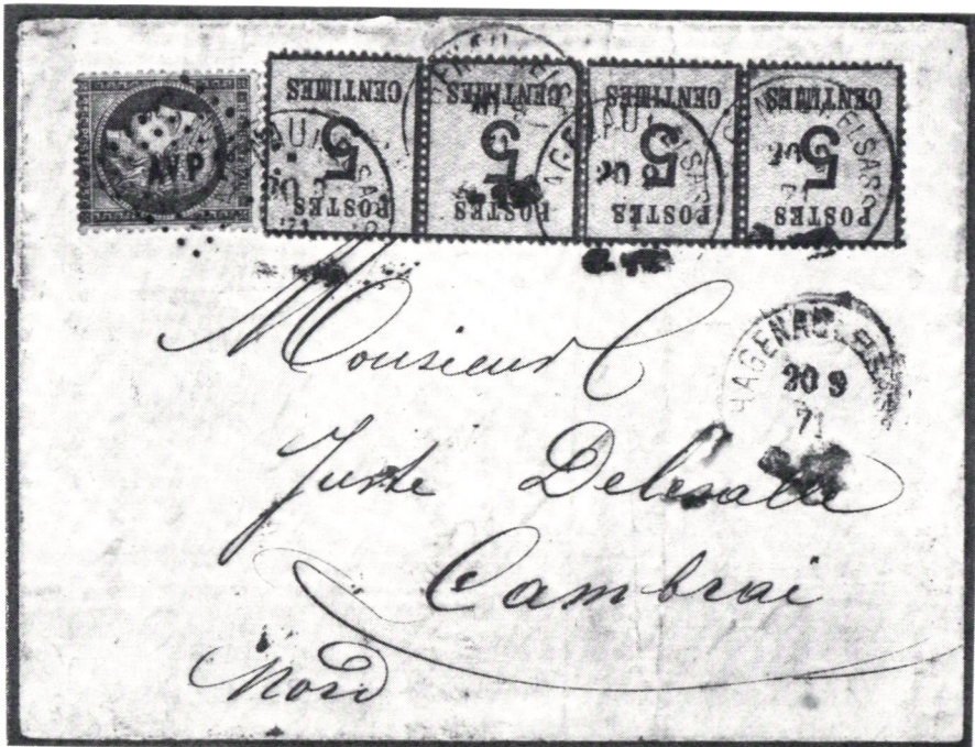
Brev från det av tyskarna ockuperade Alsace till det fria Frankrike, i laga ordning försatt med såväl tyska som franska frimärken. AVP 1 är en fransk järnvägspoststämpel (Avricourt à Paris, dag).

Den 1/7 1867 var det Nordtyska förbundet en realitet, som den franske kejsaren, Napoleon II, hade all anledning frukta. Särskilt illa klämda kände sig fransmännen, då furst Leopold av Hohenzollern friade i Spanien. Detta hände i maj 1870. Den 13/7 detta år gjorde fransmännen ett desperat försök att få kungen, Karl Anton, att avstyra frieriet. De utsända delegaterna fick dock »kalla handen», varför ministerrådet under Napoleons ledning redan den 14/7 beslutade förklara tyskarna krig. Beslutet offentliggjordes i senaten den 15, och den prussiska regeringen (Bismarck) informerades den 19 juli. Napoleon reste till gränsen för att