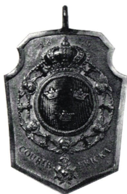
Kunglig vapenbricka från 1835

Under de följande årtiondena förekommer ofta nya förordningar och förbud mot övervåld och missbruk. År 1577 utfärdades förbud mot att skjutsa någon som inte hade kungligt postvapen och adeln befalldes att omedelbart återställa postvapen som någon gång anförtroddes dem för kungligt uppdrag, och att inte behålla och bruka dem för egna angelägenheter. Också sägs, att många vagnbrev, som var tillverkade med det kungliga som förebild, användes för att bedra gemene man. År 1584 heter det: »Så lida de icke desto mindre orätt och övermod nu, mest från de förnämsta här i riket och av deras tjänare, så också från andra som köpmän, skrivare, fogdar, hovfolk och soldater som i sina egna angelägenheter resa hit och dit i riket». Också förordnades om anläggande av flera värdshus och en nya taxa fastställdes. »Och på det att nämnda gästgivare bättre skola kunna förvalta och upprätthålla sina befattningar, så vilja vi härmed nådigt unna och efterskänka alla årliga avgifter och andra bestämda och obestämda pålagor för de hemman de besitta, som är förfallna till betalning och från andra våra undersåtar kunna avfordras; också befria vi dem från pålagor, körningar och dagsverken, konskriptioner och andra små tjänstskyldigheter. Och för att våra trogna undersåtar skola bli försko-