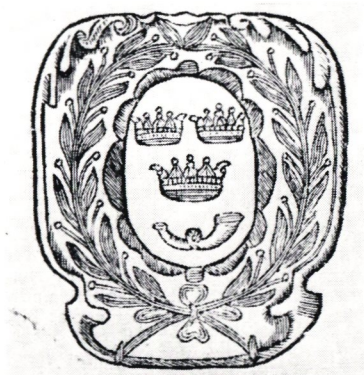
Postal vapenbricka från slutet av 1600-talet.