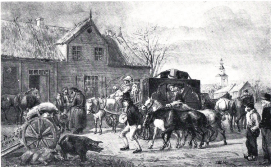
Gästgivargård. Akvarell av Fritz von Dardel.

Inrättningen heter skjuts , skjutsning . I stället för posthusen i andra länder finns i Sverige såväl i städerna som på landet liknande hus och gårdar, gästgivargårdar . Dessa har särskilda fri- och rättigheter, små fördelar i fråga om åkrar och ängar, andra att förtiga. I de folkrikare pro-