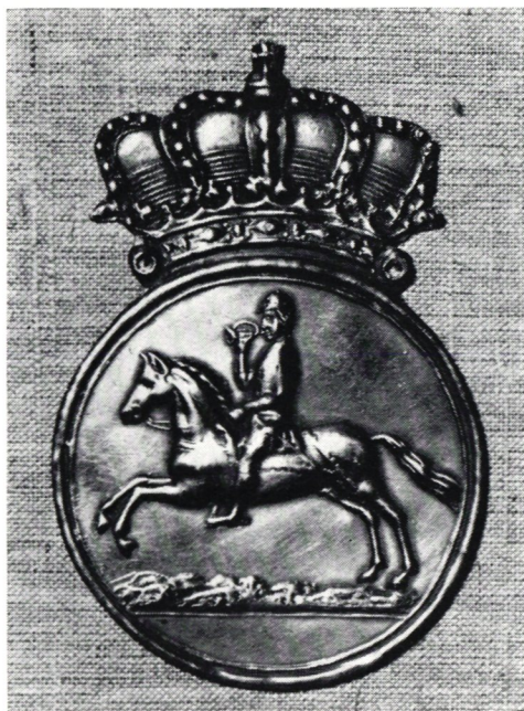
Postiljonsbricka från 1800-talet.

Brevposten har ingenting med hela denna skjutsinrättning att göra, och den står inte heller under landshövdingens och länsstyrelsens utan under kanslikollegii styrelse. För denna brevpost finns särskilda hemman antagna över hela riket. Mot skyldigheten att befordra brevposten till nästa station åtnjuter de vissa friheter, såsom befrielse från konskription, skjutsning, inkvartering och dagsverksskyldighet. Några får också pengar och annan gottgörelse på köpet.