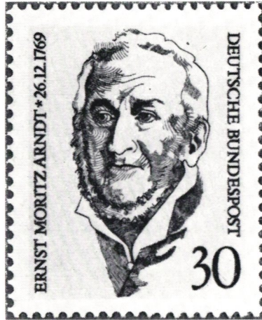
ERNST MORITZ ARNDT

När det svenska postverket invättades och postbönder ålades att vidarebefordra posten till nästa posthemman enligt stafettmetoden, så var en av huvudanledningarna kravet att befria allmogen från missbruk av den rätt till fri skjuts och förplägnad som sedan gammalt tillkommit kungens kurirer. Våldgästning påtalas redan på 1200-talet och Gustav Vasa nödgades 1538 föreskriva att de som hade rätt till friskjuts skulle bevisa detta med ett särskilt tecken på bröstet, ett postvapen. Att missbruket inte avstyrades härigenom framgår av att postvapnets utseende ändrades i ofta återkommande förordningar, år 1595 föreskrevs bl a hur vapnets utförande skulle ange det antal hästar kuriren kunde fordra.