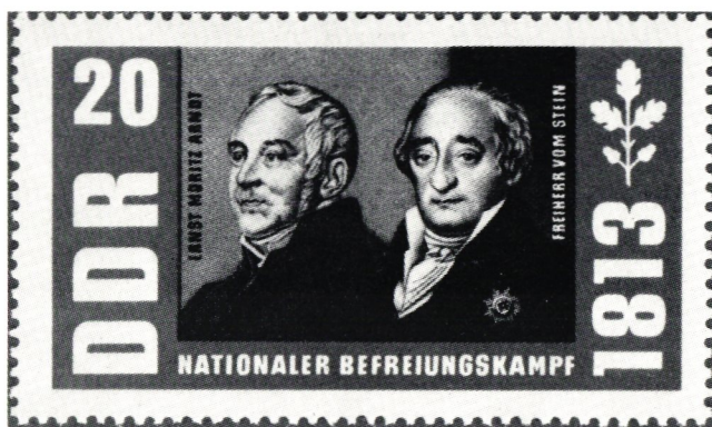
Ernst Moritz Arndt och vom Stein.

Efter preussarnas nederlag vid Jena nödgades Arndt fly undan Napoleon till Sverige. Han var under tre år verksam i Stockholm, bl a med att översätta svensk lag för Pommerns räkning. 1810 återfick han sin professur i Greifswald men lämnade den snart för att på begäran av statsmannen, friherre Karl vom und zum Stein (1757—1831) resa till Peters-