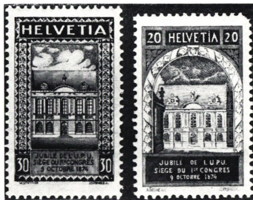
Gamla riksdagshuset i Bern, huset där Världspostföreningen bildades. Schweiz 1924.

hade dock förts innan dess i det gamla förnämliga riksdagshuset i Bern, där kongressen hölls.