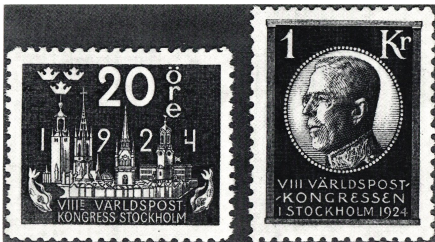
VIII:e kongressen i Stockholm 1924. Frimärkena saknar landsnamnet Sverige.

Den 8 juli 1873 överlämnade den tyske ministern i Stockholm till utrikesministern ett memorandum med därtill hörande bilagor. Det innehöll