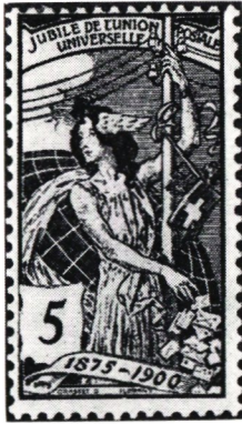
Världspostföreningens 25-årsjubileum, Schweiz 1900.