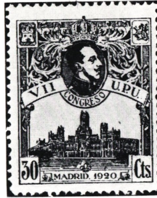
VII:e kongressen hölls i Madrid 1920. Spanien 1920.

Men Pariskongressen hade endast dryftat ett program bestående av teoretiska teser. Stephan rekommenderade en praktisk uppgift: att mellan samtliga deltagare avsluta ett fördrag genom vilket skulle skapas en livskraftig gemenskap på det postala området.