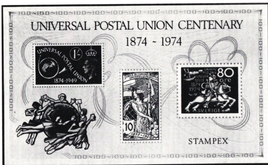
Minnesblock till UPU:s jubileum, utgivet i England för utställningen Stampex.