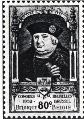
XIII:e kongressen i Brüssel 1952. Motiv: Franz von Taxis. Belgien 1952.

— De kommer ändå inte fram! kunde den av allt blädbrande i tariffböckerna uttröttade postmannen påstå. Både post och postkund blev lidande.