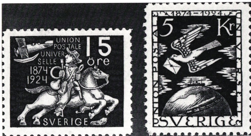
UPU:s 50-årsjubileum, Sverige 1924.