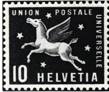
Detalj från gamla UPU-byggnaden (Schweiz 1957).

Alla plågades av de olidliga förhållandena. Alla insåg att en sanering var nödvändig. Men endast en insåg hur den skulle utföras. Det var Heinrich Stephan, den man som arbetat sig upp från enkel skrivare till postens högste chef.