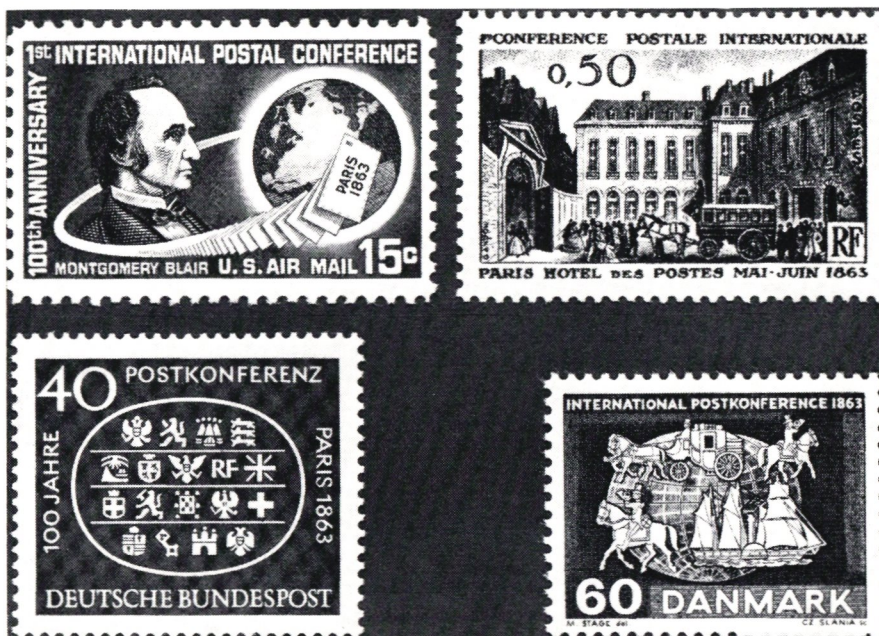
Postkonferensen i Paris 1863 hölls på initiativ av USA:s generalpostdirektör Montgomery Blair (USA 1963), i Hotel des Postes (Frankrike 1963). BRD visade vid 100-årsjubileet deltagarstaternas emblem och Danmarks minnesmärke illustrerar 1860-talets transportmedel.