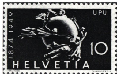
UPU-monumentet i Bern, Schweiz 1949.

att majoriteten av de europeiska postverken liksom USA:s postförvaltning visat ett närmande till de 31 grundsatser, som den i Paris år 1863 på initiativ av USA:s generalpostdirektör Montgomery Blair hållna postkongressen rekommenderade som förebildliga vid uppgörande av postfördrag.