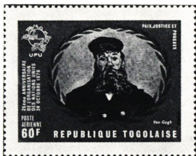
Till FN:s 25-årsjubileum 1970 gav Togo ut detta frimärke, som återger målning av van Gogh, föreställande en fransk brevbärare och UPU-emblemet.