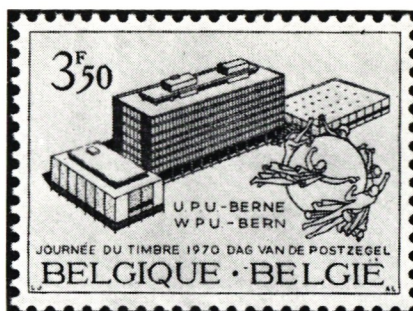
UPU:s nya byggnad i Bern på frimärke till Frimärkets Dag i Belgien 1970.