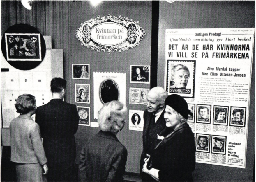
Från utställningen »Kvinnan på frimärken».