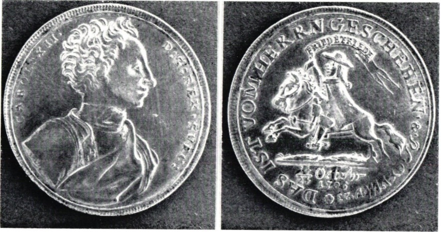
Medalj i silver från freden i Altranstätt 1706.

Brevomslag, vykort, helsaker och aerogram från Österrike, Storbritannien, Trinidad, Tobago, Dominica och USA. Kopia av holländskt vykort, som skadats vid järnvägsolyckan i Rörvik den 6.9.1954 samt historik (Friedrich Schaffer, Nacka);