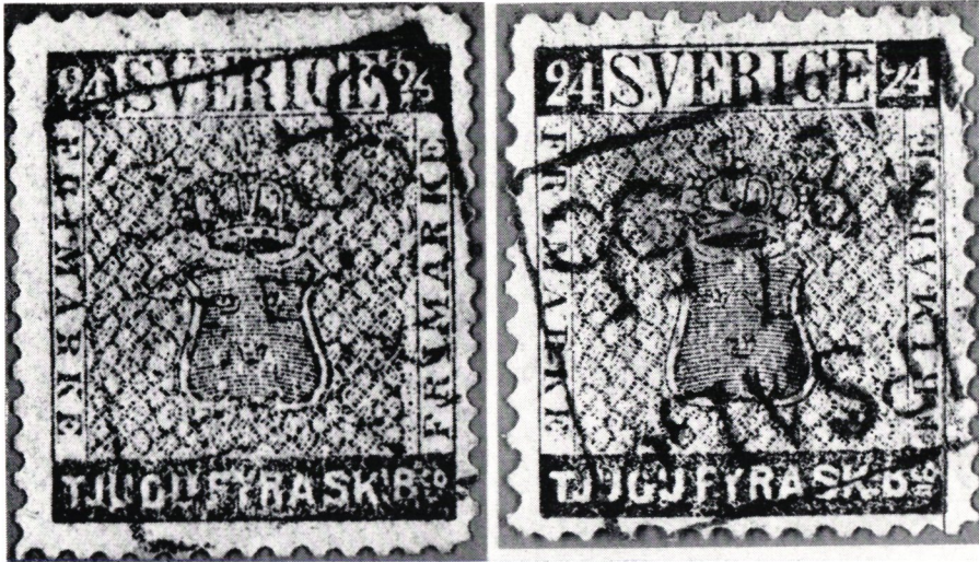
Förfälskade 24 sk bco, stämplade Upsala 7.8.1855.

sändelser till Sjöpostsamlingen och samlingen Ångbåtspost; 1 flygpostbrev stämplat Karlsborg 22.1 1921; 1 flygpostbrev stämplat Falun 11.10 1920; 1 raketpostbrev stämplat raketbasen Kronogård 17.9 1968; 1 Dagens Nyheter, extra flygpostupplaga, 29.8 1912.