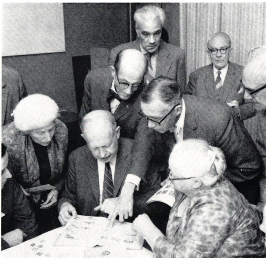
Från sammankomst med Stockholmspensionärernas Frimärksklubb.

Söndagar var en kassaexpedition öppen för försäljning av frimärken och mottagande av vanliga och rekommenderade brev. Frimärksförsäljningen uppgick under året till 52.260: — kronor.