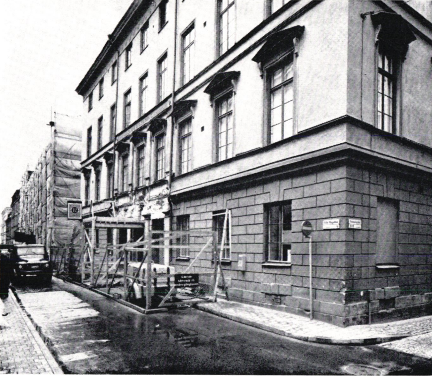
Postmuseums fasad under pågående arbete med entrén.

Efter brandinspektion har föreskrivits att nödutgång åt Munkbrogatan skall öppnas. Arbetet härmed har påbörjats.