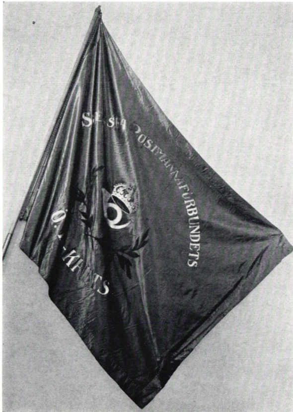
Fana som tillhört Svenska Postförbundet.