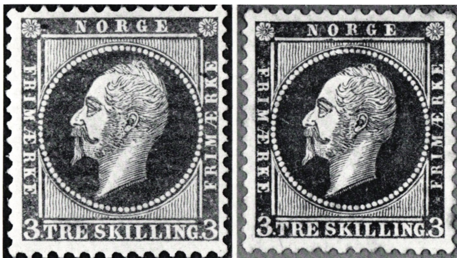
Nymans provtryck till norska frimärken med Oscar I.

Norge: Frimärken utgivna 1.7 1957; Nymans provtryck 1 st 3 skilling gul och 1 st 3 skilling blå, Oscar I.