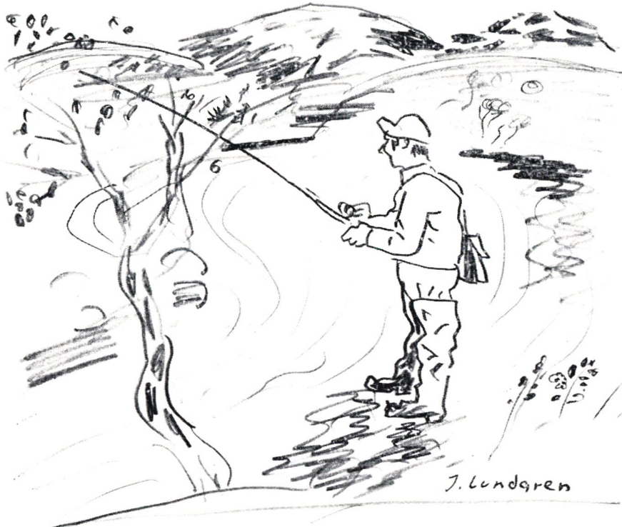
Gott fiskevatten. Teckning av Johan Lundgren.

Hur det moderna arbetarskyddet i Posten ska presenteras är avklarat. — Hej då, vi ses snart igen! Vi lämnar n'Robin och vandrar ut i en ljuvlig sommarafton i Lapp-Stockholm. På Stora torget inviger Skogisarna ett klotterplank med bihang. Högtidstalaren lovar röja undan det sista som skiljer stan från det sydliga Stockholm och täckelset faller. På vita delen av tavlan läser vi i kvällningen: »Billigare snus!» och »Bort med hårdsprejade flickor från Ansía.» Bihangstavlan är för spridare av runda ord. Enkelt nog, en svart tavla med svarta kriter. n'Robin har ordnat ett mysigt familjhotell. Utsikt över Umeälven som med blankt vatten skiljer oss från andra sidan — Ansía — med många fina turistanordningar.