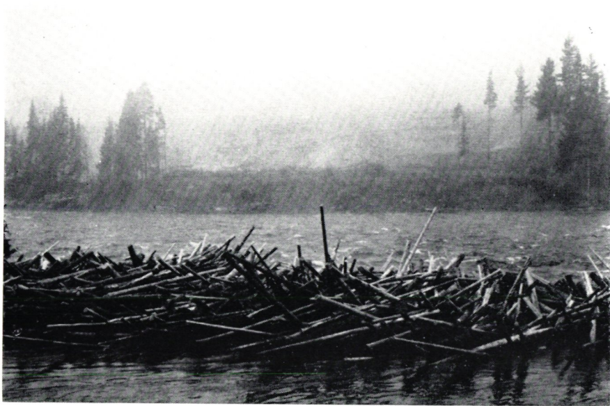
Timmer i Ängermanälven vid Resele.

Vi borde släppa loss hela Sverige med barn, blomma, släkt och goda vänner på Blå Vägen i sommar eller en annan sommar. Vilken geografilektion för skolbarn! Där finns fisk, våfflor, fria vidder, fria rymder och vänliga människor redo och tar emot. Tror bestämt n'Gösta gillar att vi