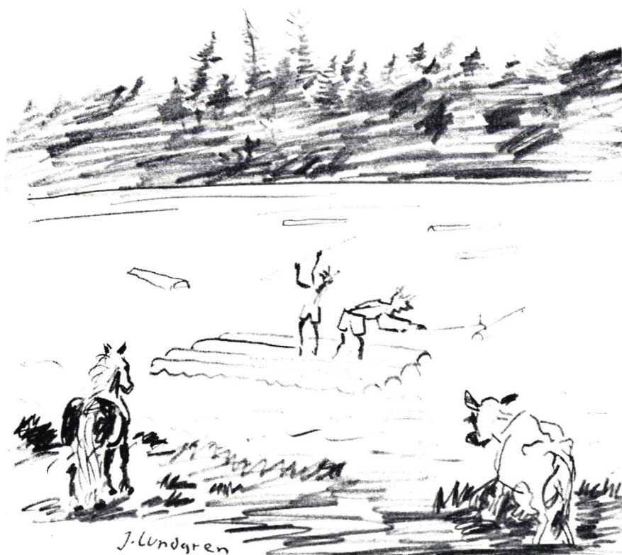
Äventyrlig timmerbärgning. Teckning av Johan Lundgren.