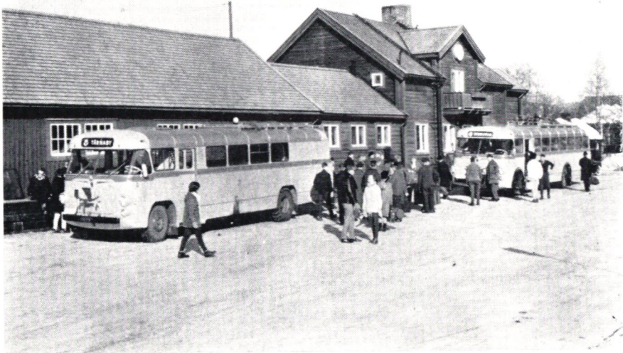
Bussar vid järnvägsstationen i Storuman.

Norska sidan stupar brant i serpentinsvängar. a'Scania får god användning av sina slanka linjer. I Mo finns järnverk. Röken pudrar björkstammarna rosafärgade, husväggar och allt. Vi äter middag på hotell. Skriver vykort. På tomten intill nattar n'Albert våran Scania som först fått nytvättade utsiktsfönster av n'Albert. — Morgon igen. n'Albert sysslar med nypåstigna. Expedierar fermt i svenska och norska kronor med hjälp av