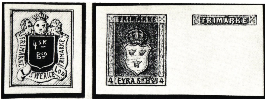
Förslagen till skill.-bancomärkena i Postmuseum.