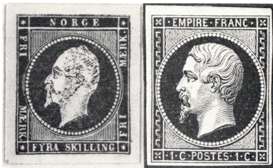
Provmärke till Oscar I-typ Norge (1856) och Napoleon-typ Frankrike 1853. Det norska originalfrimärket är avbildat överst till vänster på bilden å sidan 102.