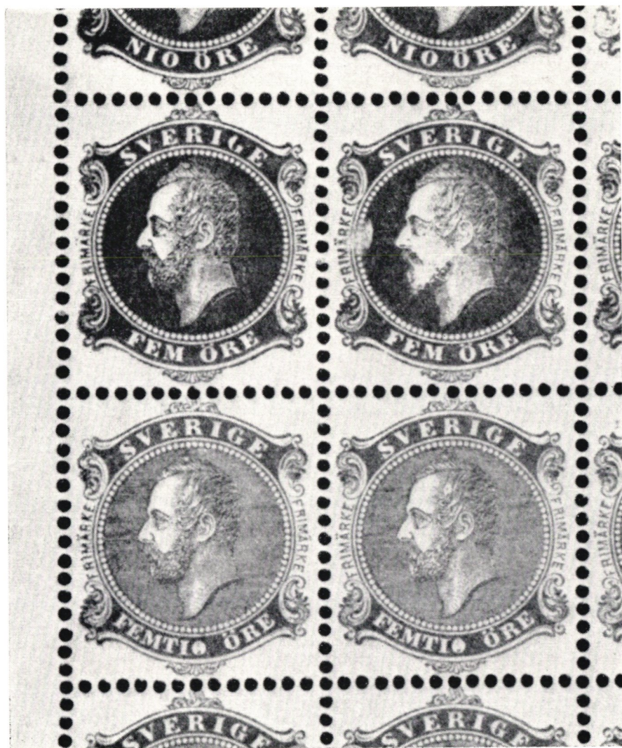
Förstoving av 4 märken i vänstra sidan av den helkarta som finns i Postmusei ägo och vilken ej tidigare varit avbildad i filatelistiskt sammanhang.