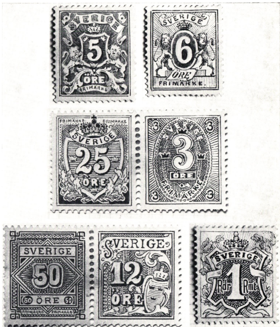
Frimärkesförslag i blyerts och akvarell, tecknade på baksidan av förslagsmärken i Carl XV-typ.