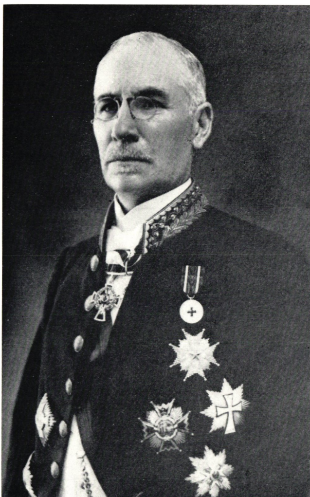
Generaldirektör Julius Jublin i paraduniform på 1920-talet.

mästare klass I B och överkontrollör. Ett emblem hade postmästare av klass 2 A, förste kontrollör, aktuarie, förrådsförvaltare, registrator, revisor samt postmästare av klass 2 B.