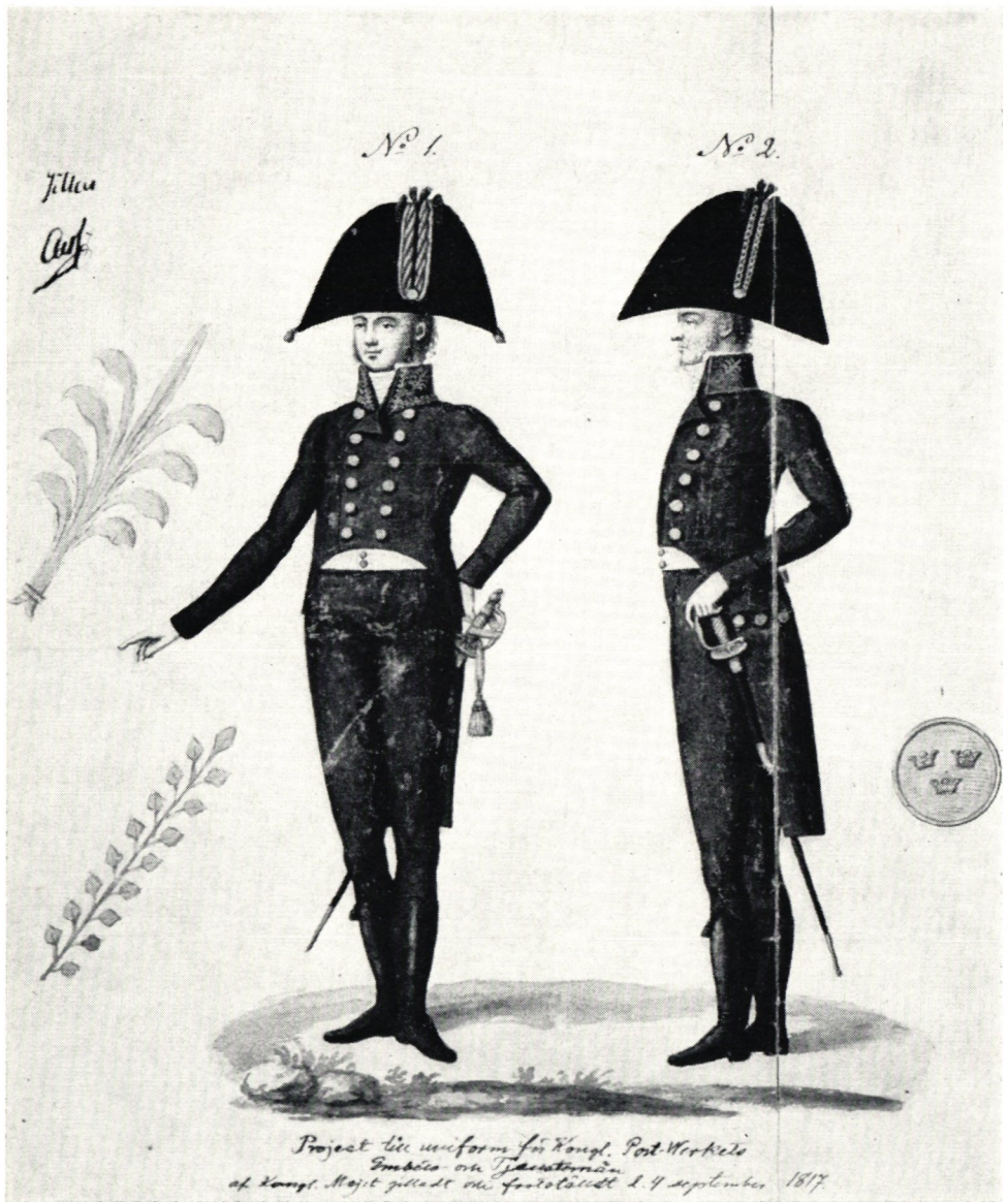
»Project till uniform för Kongl. Post-Werkets Embets- och Tjenstemän», gillad och stadfäst av Kungl. Maj:t den 4 september 1817. Original i Postmuseum, Stockholm. Den vänstra dräkten visar generalpostdirektörens tjänstedräkt och den högra postmästarens.