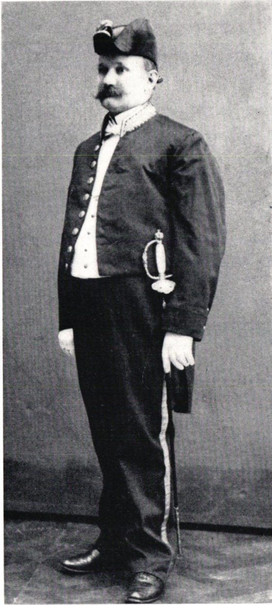
Paraduniform för postmästare modell 1866.