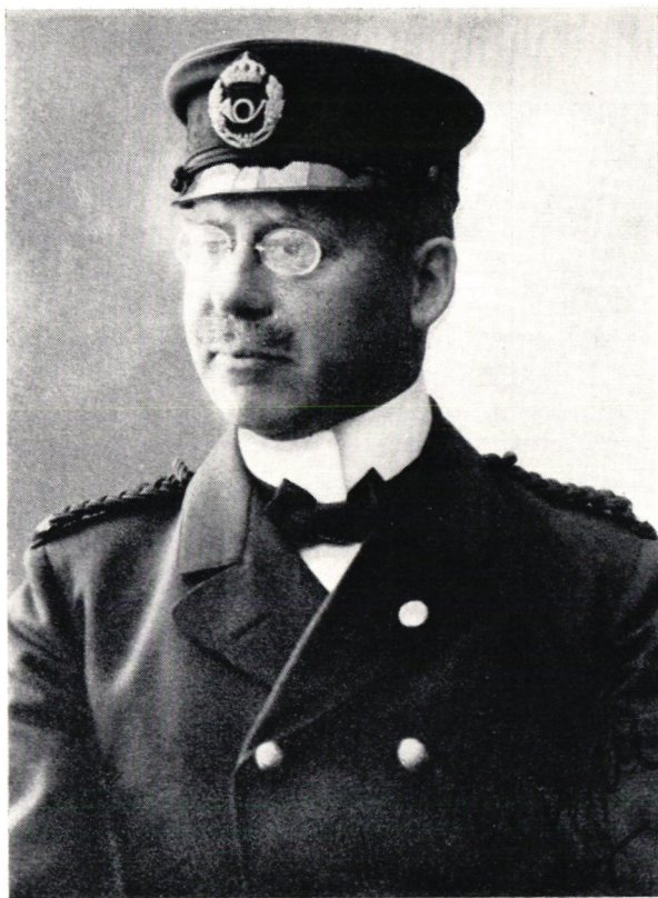
Släpuniform för postassistent, 1930-talet.

På 1890-talet finner man i SVENSKT POSTARKIV likaså artiklar som tar upp uniformsfrågan, och det är tydligt att den inte var helt oväsentlig.