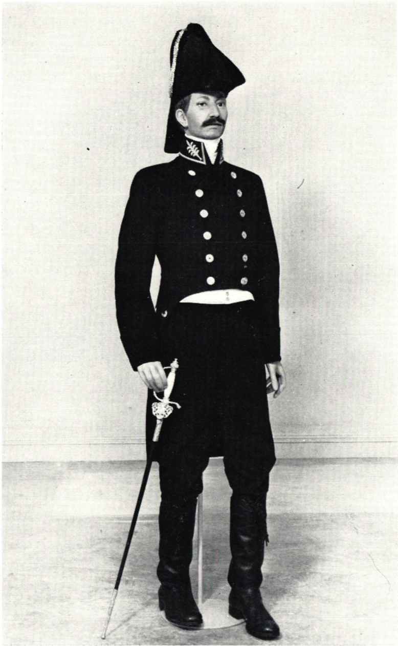
Postmästareuniform från år 1817.