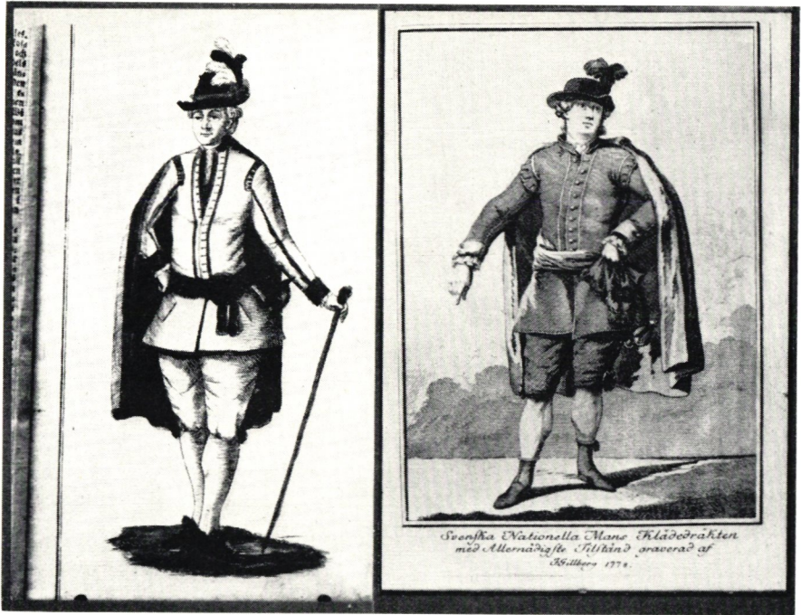
Svenska dräkten år 1778 i två olika utföranden. Det är mycket sannolikt att denna typ av dräkt har burits av högre posttjänstemän.