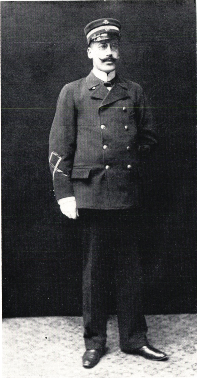
Postexpeditörsuniform vid sekelskiftet.