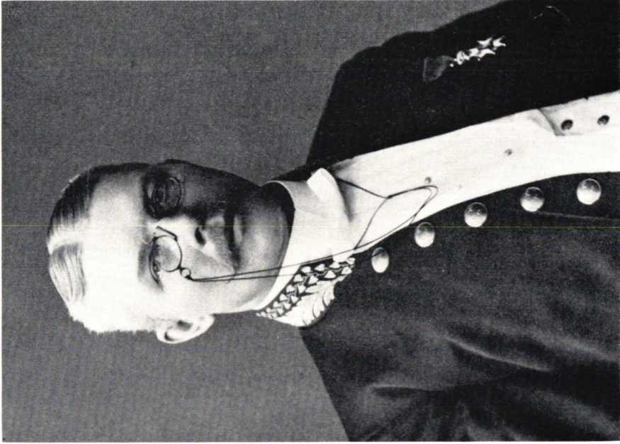
Paraduniform för postmästare resp. postdirektör från början av 1900-talet. Modellen är fastställd år 1866.