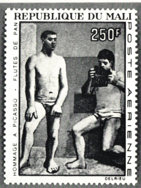
De båda Picassodukarna Fågelburen och Panflöjten målades 1923 (Mali 50 och 250 Fr). På nästa sida ser man Kvinnorna från Avignon 1906—07 (Senegal 100 Fr) och däröver en svensk Picassostämpel 1966.