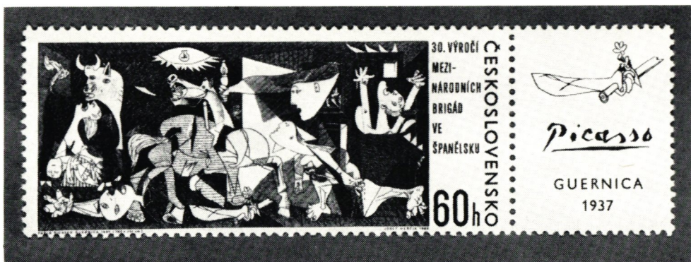
Guernica 1937 på ett tjeckoslovakiskt frimärke 1966. På märkets »tab» ser man en skiss till målningen, en arm med avbrutet svärd och konstnärens signatur.

Burundis Picassomärke släpptes också ut 1967. Här är »Akrobat med boll» på Pusjkinmuseet i Moskva förebilden. Den tillhör en tidigare period.