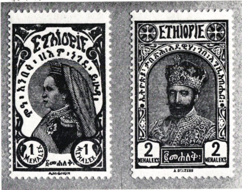
Kejsarinnan Zeuditu och Negus Tafari (Haile Selassie I) ur 1928 års serie tryckt i Paris med gravyrer av A. Mignon och A. Delzers.

egendom, blev 1928 års ursprungliga frimärksupplagor ännu en gång överstämplade med kraftiga anilinstämplor, föreställande ett stiliserat flygplan, omgivet av en amharisk text: »YeY:me. Aeroplane 10 Nahasie 1921», vilket betyder: »Etiopiska regeringens flygplan, 16 augusti 1928».