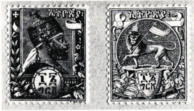
Kejsar Menelik och riksvapnet »Juda lejon» ur 1893 års serie.

De tre första schweiziska posttjänstemännen Muhlé, Wullschleger och Spitzer anlände till Etiopien och organiserade från och med den 22 augusti 1899 en regelbunden postdistribution. Efter hand som järnvägsarbetena fortskred, begagnade sig postkurirerna av den färdiga bandelen för transporten av postsäckar.