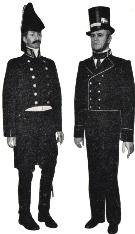
Paraduniform för postmästare på 1820-talet och uniform för båtsman å postångfartyg på 1830-talet.

Föreningen Postmusei Vänner har skänkt Postmuseum en jordglob, som kan upplysas inifrån. Det är avsett, att globen skall monteras upp vid en vägg i det första rummet av den utländska frimärksavdelningen.