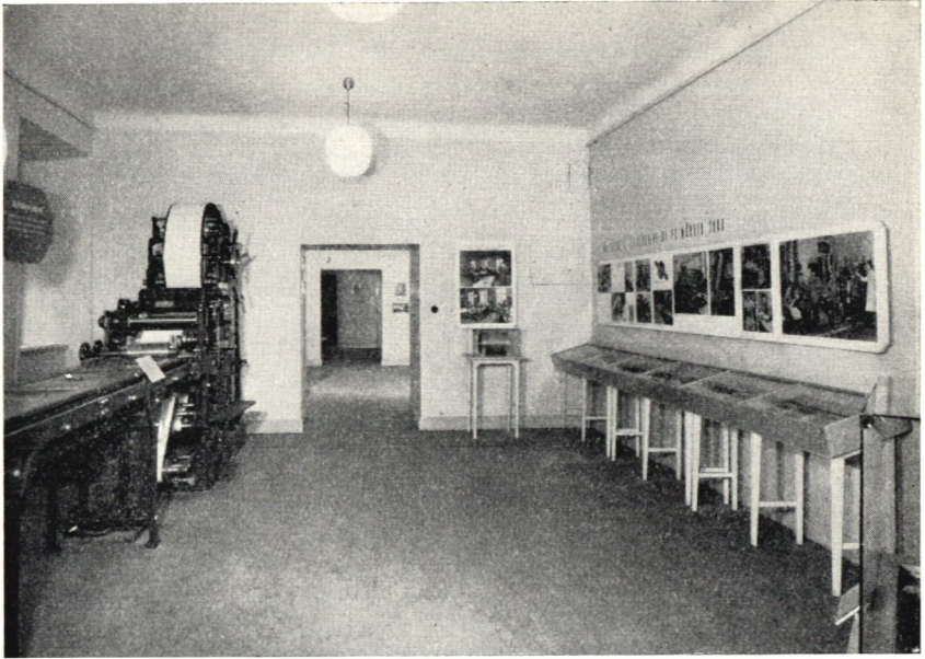
Frimärkstryckpress och i montrerna tryckmateriel till äldre svenska frankotecken.