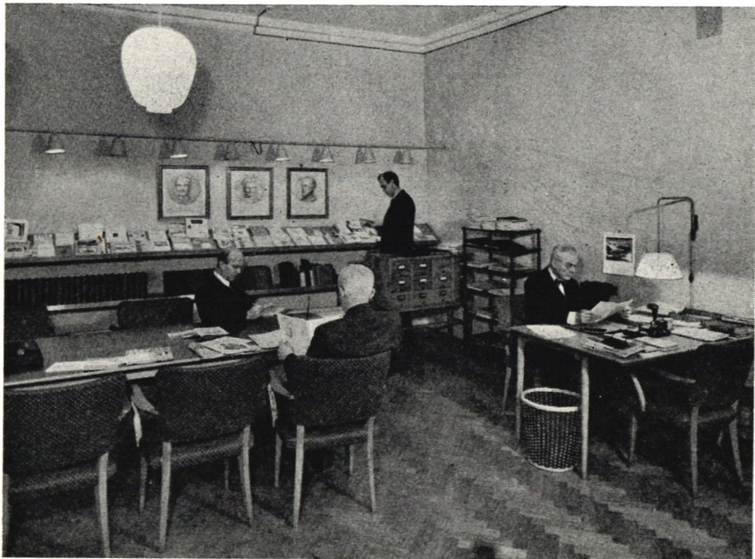
19 Bibliotekets lärum.

I början av 1940-talet hade boksamlingen antagit sådana dimensioner, att endast två alternativ kunde ifrågakomma. Antingen måste jag själv till följd av utrymmesbrist ge mig iväg eller också hade detta öde att drabba biblioteket. Det fanns 16 bokhyllor i den lilla våningen, och dessutom hade allt tillgängligt utrymme i källare och på vind anlitats.